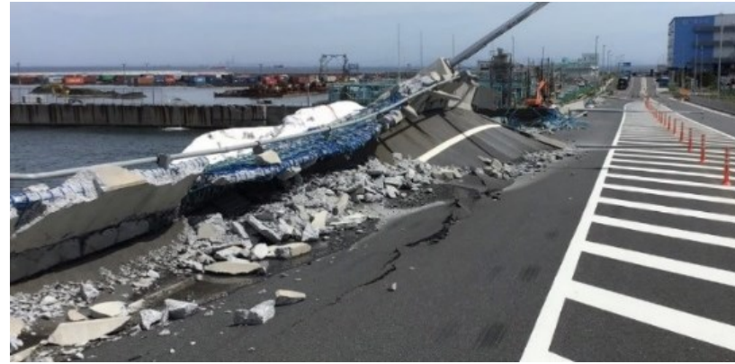
台風第15号により錨泊していた貨物船が臨港道路に衝突し、鋼床版のめくり上がり及び高覧(コンクリート製)の損壊