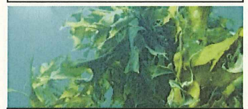
ワカメによる貝類養殖被害 (1980年代後半~ オーストラリア、北米大陸太平洋岸)