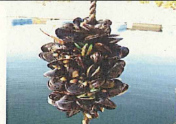
ムラサキイガイによる漁業被害 (1970年代~ 日本・広島湾等)