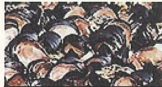
ゼブラガイによる発電所被害 (1989~2000 米国・五大湖)