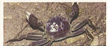
中国モクズガニによる漁業被害 (1910年代~ 欧州・ドイツ、バルト海)