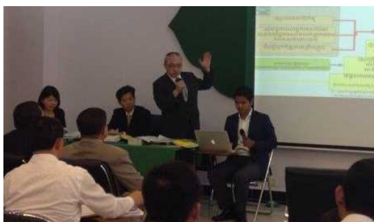
意見交換会の様子①