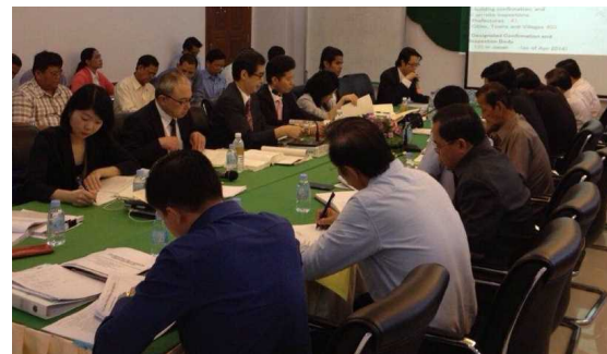
意見交換会の様子②