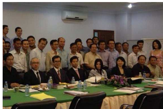
意見交換会参加者