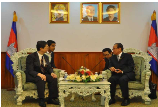
イム上級大臣への表敬