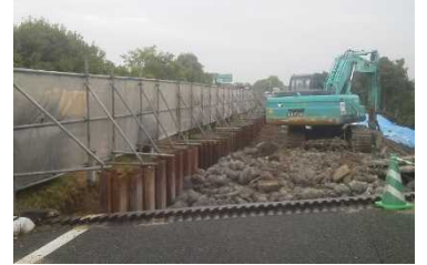
盛土の復旧工事実施中

※ 益城熊本空港IC~嘉島JCT間は2車線で一般開放 木山川橋は速度規制(20km/h)