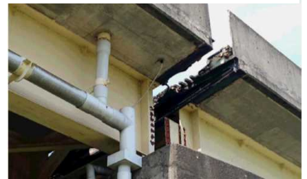
桁のずれ(開き 約30~40cm) ⇒上り線を応急復旧