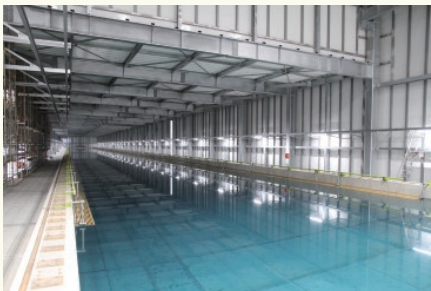
新設中の試験水槽（曳航水槽）

試験水槽の慢性的な不足が問題になっていたことから、民間施設としては大型の全長212mの曳航水槽と、波浪中における船の挙動試験にも対応した耐航性水槽を丸亀事業本部に新設しています（2020年稼働予定）。