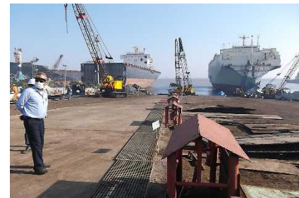
適正に管理された解体施設