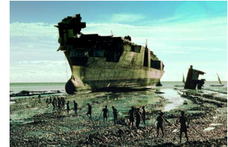
労働安全・環境対策がされていない途上国の解体施設

シップ・リサイクル条約を早期に締結し、安全・環境に配慮した国際的な船舶リサイクル制度を構築することにより、適正な船舶リサイクルを実施している日本の海運事業者が適正に評価され、国際競争力を確保することが必要