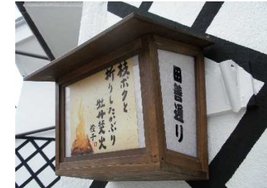
風流を創出する軒行灯の設置