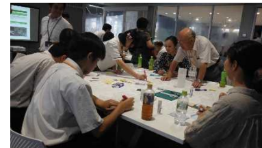
文化交流拠点整備(ワークショップ風景)