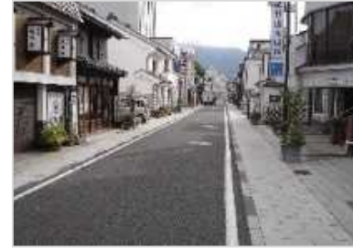
景観形成を促す石畳舗装整備