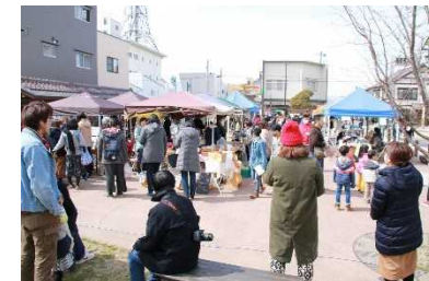
官民連携マーケットイベント