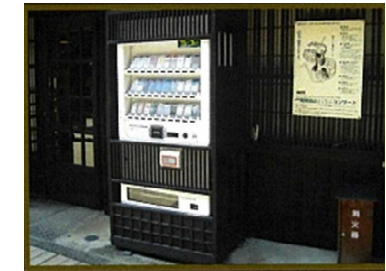
面格子による趣きのある景観づくり