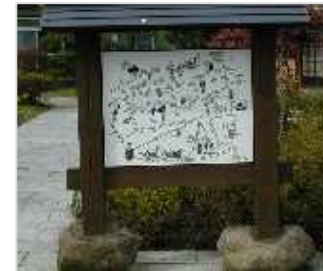
地域案内看板整備