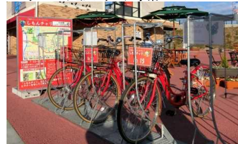
コミュニティサイクルしもんチャリ拡充による、まちなか回遊性向上