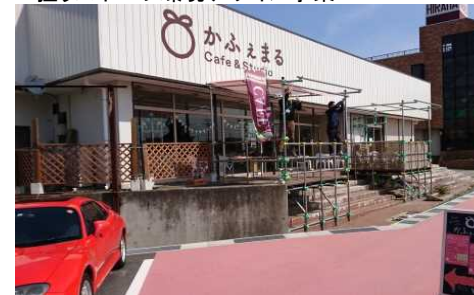
空き店舗のリノベーションを推進するリノベーションスクール事業