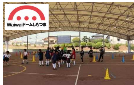
にぎわい広場にクライミング施設等スポーツコンテンツの充実