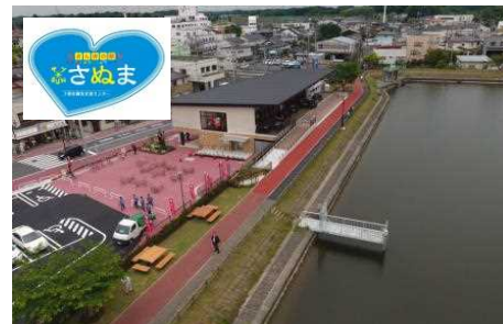
水辺のリノベーションを進めるための親水デッキの整備