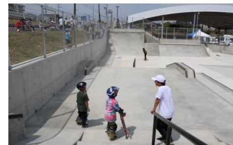
スポーツを手段として交流人口と消費拡大を狙うスポーツ環境デザイン事業