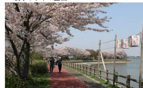
景観型街路灯の整備(砂沼遊歩道)