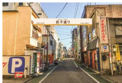
市道886号線(宮島町通り)整備