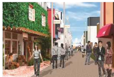
市道3号線(ユニオン通り)整備