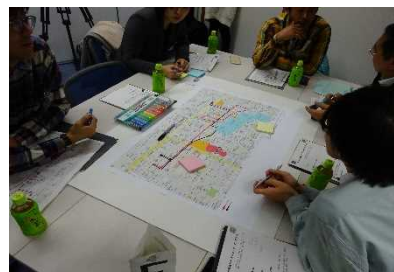
民間主体による低・未利用地等の有効活用の促進