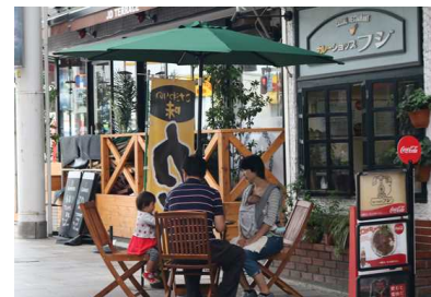
オープンカフェの実施(オリオン通り)