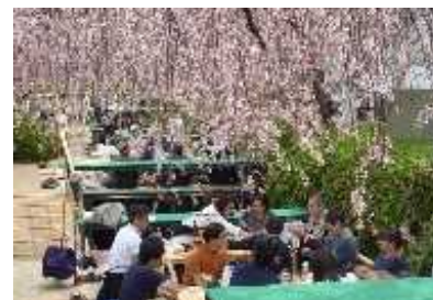
親水空間を活用した賑わい創出事業の実施・拡充(釜川周辺地区)