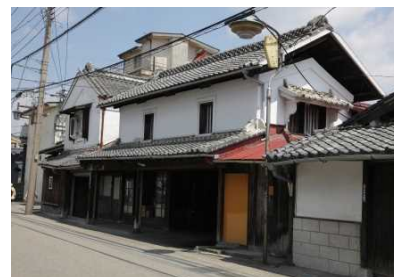
文化財建造物等を活用した地域活性化事業 拠点施設整備(旧味噌工場活用)