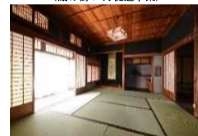
蔵の街移住体験 (蔵の街づくり促進事業)