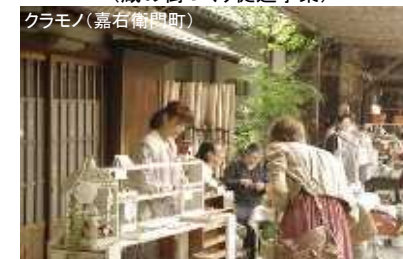
蔵の街並みを活用したイベント (蔵の街づくり促進事業)