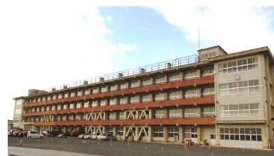
(仮称)地域交流センター整備 (旧小学校校舎活用)