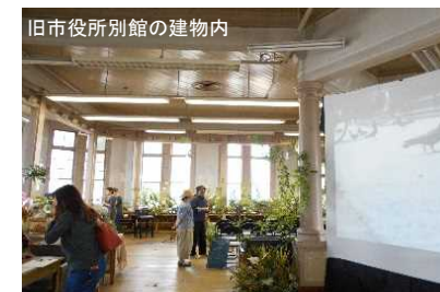
(仮称)文学館を活用したイベント (蔵の街づくり促進事業)