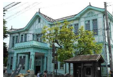
(仮称)文学館整備(旧市役所別館活用)