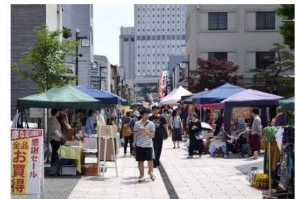
⑯エリアマネジメントによる賑わい創出