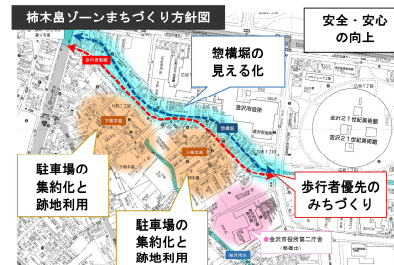
③中心市街地まちなみ形成事業