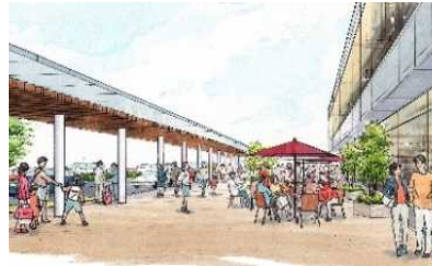
①金沢駅周辺歩行環境整備事業