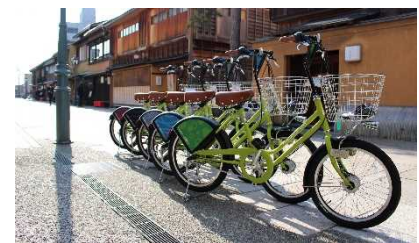
⑫公共レンタサイクルによる回遊性向上