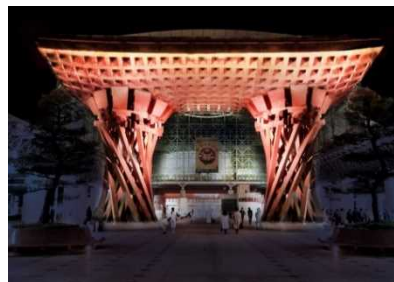
⑤夜間景観アクションプログラム