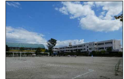
旧西藤山台小学校の利活用事業