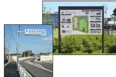
広域案内や施設誘導の情報板設置