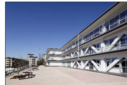
高蔵寺まなびと交流センター整備事業