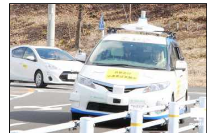
新交通ビジネス実現化事業