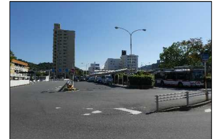
高蔵寺駅周辺再整備による顔作り事業