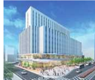
複合施設整備(川越駅西口市有地活用)