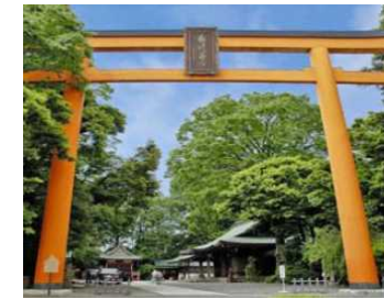
地方創生推進交付金事業(縁結びのお手伝い)