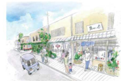
昭和の雰囲気を感じられる将来のまちのイメージ 地域主体による街づくりルールの作成、推進