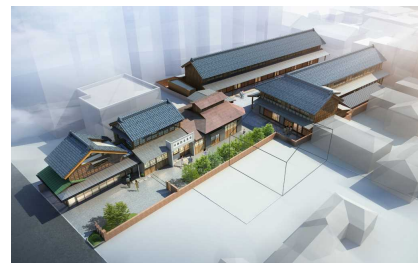
歴史的建造物を活用した文化創造インキュベーション施設整備