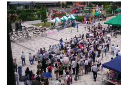
川越駅西口地区エリアマネジメントワーキンググループ活動