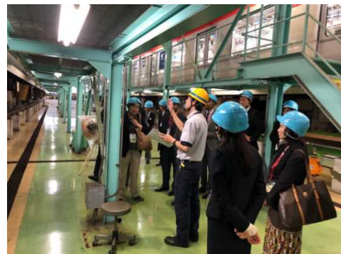
＜車両基地視察の様子＞