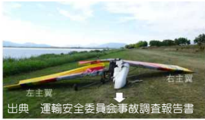
出典 運輸安全委員会事故調査報告書

【事故例①】 令和2年6月9日、佐賀県で、超軽量動力機がジャンプ飛行中に墜落。機体は大破し、操縦者1名死亡。 > 許可の有無：許可は取得していたが、同機のプロペラは型式仕様書と異なる直径のものと交換されていたことから、航空法第11条第1項ただし書の申請区分「改造」に該当するものの、改造に係る飛行許可申請はされていなかった。 > 原因：プロペラ・ブレードが損壊し、飛散した破片の一部が左主翼に衝突し、左主翼前方結合部が分離。