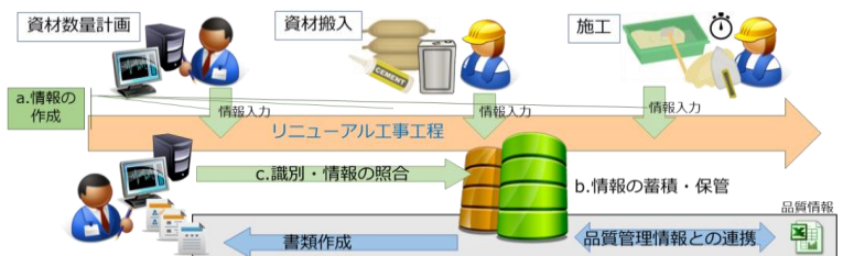
図4 補修材料のトレーサビリティシステム概要