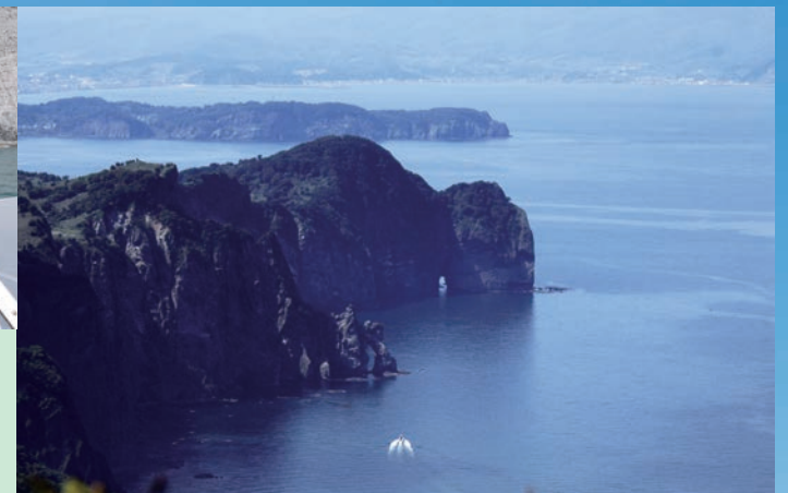
オモタイ海岸から窓岩へ