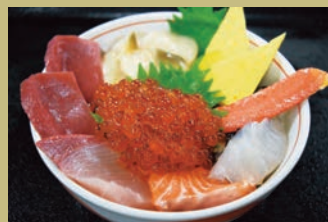
余市「柿崎商店」 (0135-22-3354) の海鮮丼