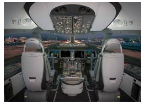
【高度化した操縦システム】