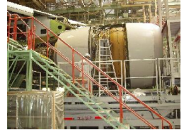
【航空機の修理・改造】