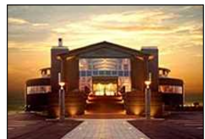
三国温泉ゆあぼ～と