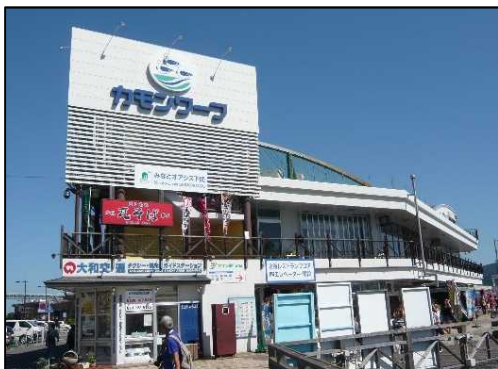
構成施設のイメージ