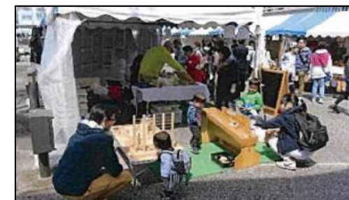
アートクラフトフェア