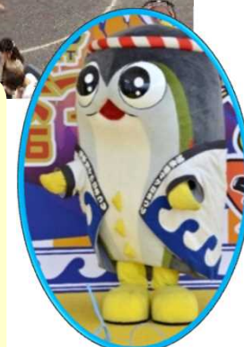
マスコット「まぐまぐ」