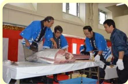
マグロ解体ショー