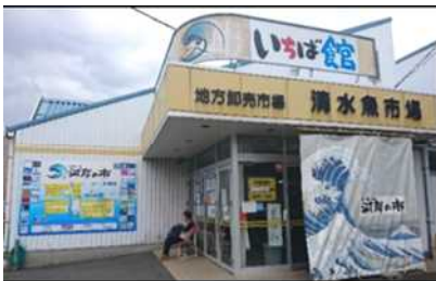
「清水魚市場「河岸の市」