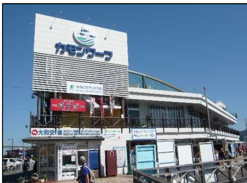
構成施設のイメージ