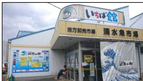
清水魚市場「河岸の市」