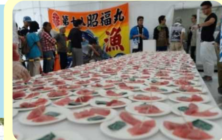
マグロのふるまい