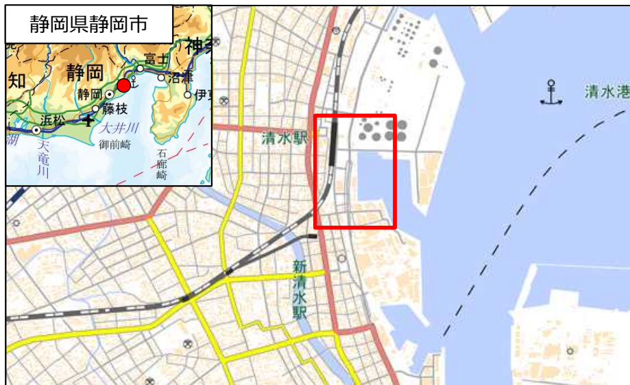
国土地理院地図（電子国土Web）( http://maps.gsi.go.jp )をもとに国土交通省作成