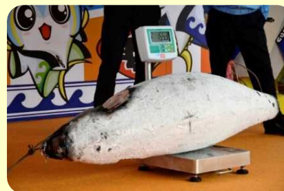
マグロ体重当てクイズ