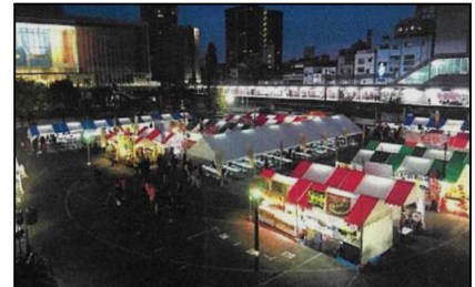
「みなと屋台まつり」

なお、6 月 17 日（日）は「清水魚市場『河岸の市』」にて「みなとオアシス登録証交付式」や各種イベント（10:00～15:00）を開催しています。