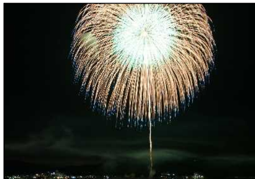
福良湾海上花火大会