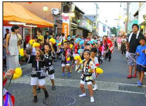
福良夏祭り 盆踊り