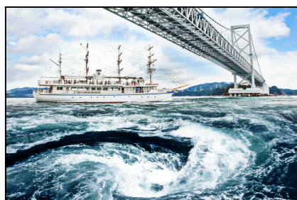
うずしおクルーズ