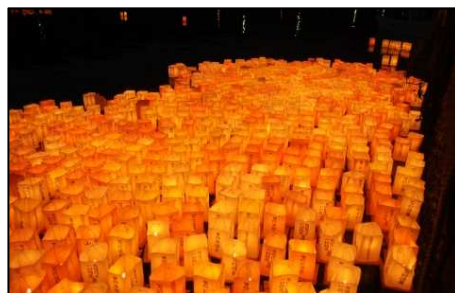
橋花火大会 (灯籠流し)