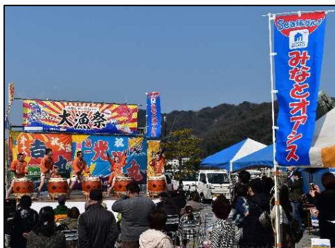
「みなとオアシス」における地域振興イベント