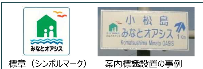
標章（シンボルマーク）