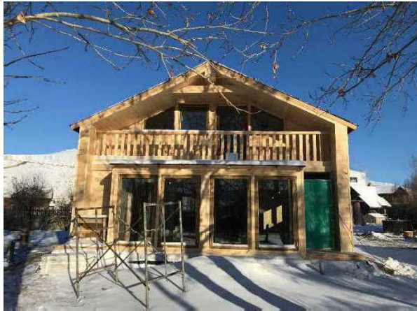
図 DIY モデル住宅