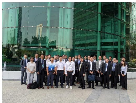
Energy Complex 視察の集合写真 (1月19日)