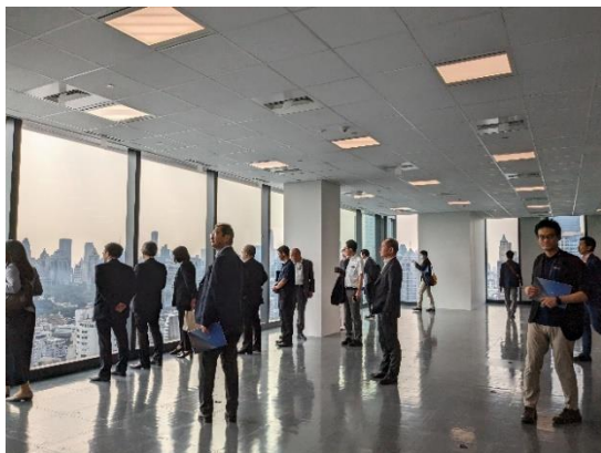
O-NES Tower 視察時の様子 (1月19日)