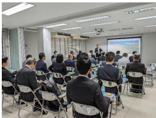
EEC 視察：レムチャバン港についてのガイダンス (1月17日)