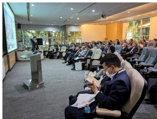
EEC 視察：AMATA 工業団地についてのガイダンス (1月17日)