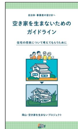
▲更新したガイドライン・HPにて公表