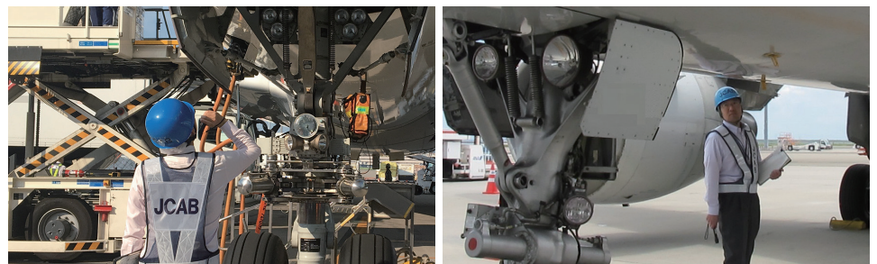
航空機の小さな部品についても、国の職員自ら徹底的に点検を行っています。2019年度は600機以上をチェックしました。

落下物の未然防止のため、航空会社による徹底的な点検が行われています。加えて、羽田空港では、国の職員による機体チェックを実施しています。新飛行経路の運用開始後は、チェック要員を増やし、更なる点検強化に取り組んでいます。