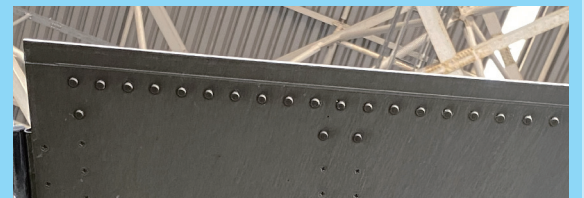
外板を接着からボルト等による取付に変更