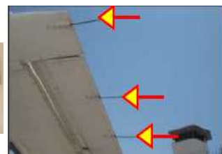
リベット(留め具) シール スタティックディスチャージャー(放電索)