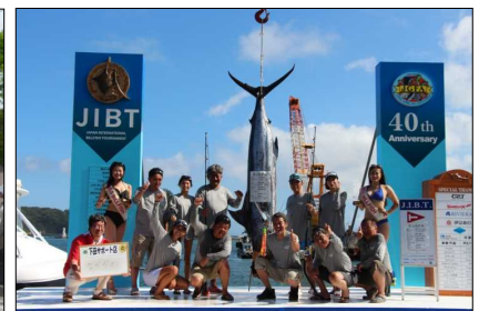
国際カジキ釣り大会