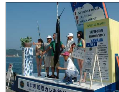
国際カジキ釣り大会