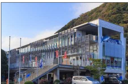
代表施設「開国下田みなと」