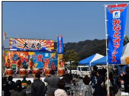
地域振興イベントの開催状況