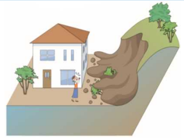
防災上の観点から適正な管理が求められる土地の例(イメージ)

◆「経済財政運営と改革の基本方針2019」(令和元年6月21日閣議決定)(抜粋)