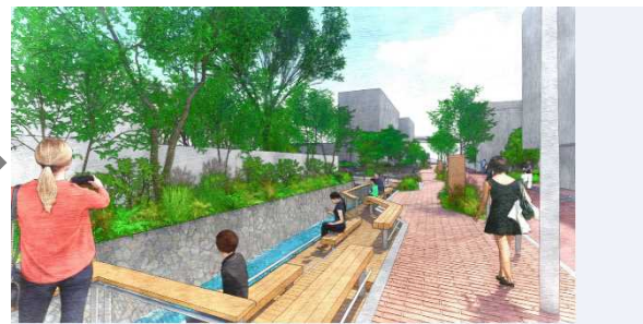
(改修後のイメージ)