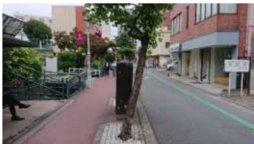
(現在の馬場川通りの様子)