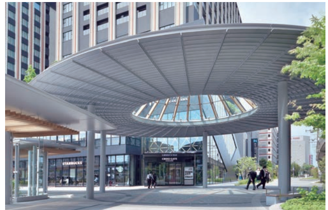
広場・歩行空間・各施設出入口が交差し広場の中心となる円形の大屋根下空間。長さ5.2mの扇形アルミキャストパネルを48枚連ねた。