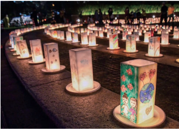
「平和の灯」の様子。子どもたちの手によってつくられた平和への願いや絵を書き入れた手作りのキャンドル3000～5000個があかりを灯す。

このような夜間景観を中心に据えた公民連携のまちづくりの展開は、日本ではまだ事例が少なく、長崎での取り組みは極めて先駆的かつ独創的であり、景観デザイン技術の進展にも大きく寄与している。以上のことから、大賞にふさわしいと評価する。(卯月)