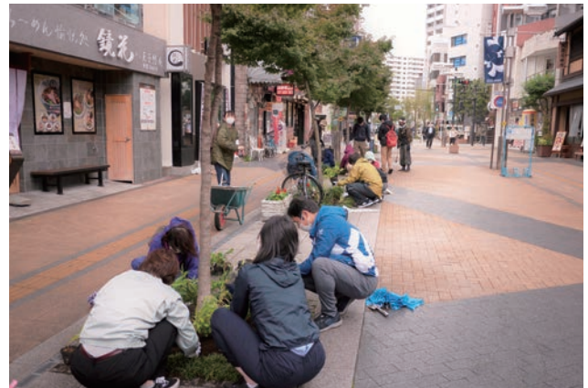
「アシナミドリ」プロジェクトでは、地元造園業者による植栽方法のレクチャーのもと参加型イベントを開催。