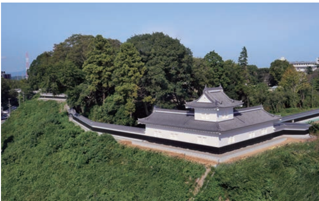
2021年6月に復元整備事業が完了した水戸城二の丸角櫓。