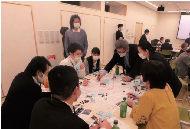
地元関係者等や大学生、景観デザイン会議のメンバーが参加した「八王子駅周辺の未来の景観を考えるワークショップ」。

実現できるのかと疑問視されたアイデアもあったが「30年後ですから」と理解を求めたという。だが八王子の『景観みらいものがたり』のほとんどは、30年もかからずに実現するだろう。（福井）