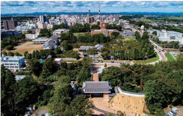
水戸城大手門背面（写真下）から弘道館・旧茨城県庁三の丸庁舎方面（写真中央～上）を望む。

市民の協力の下、面的な全体計画を立案、「象徴となる歴史的資源」を忠実に復元するとともに着実に周辺整備を行って城址の雰囲気を地区として醸成しており、「歴史まちづくり」の優れた事例であるといえる。今後、水戸駅や中心市街地との連携をさらに深めるとともに様々な市民活動がより一層活発に展開されることを期待し、特別賞を授与するものである。(岸井)