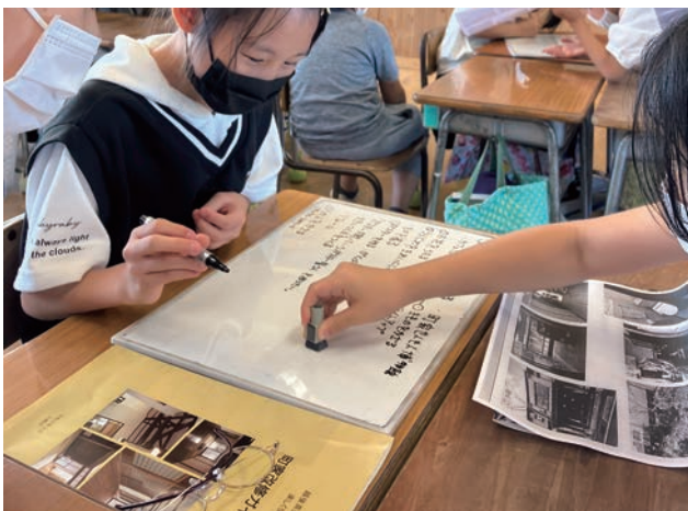
雁木のまち再生の方々から町家を一軒借りられることになったとき、どのように活用したらよいかを仲間と話し合う児童の様子。