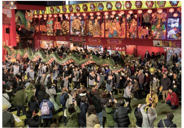
「ランタンフェスティバル」の様子。中国文化を表現した美しいあかりがまちなか全体にともり、毎年市民や観光客を含めた多くの来場者が訪れる。