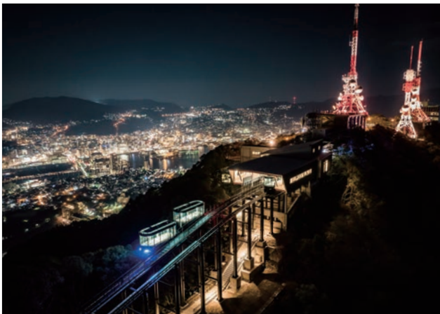
稲佐山山頂電波塔ライトアップと稲佐山スロープカー。稲佐山から「見下ろす夜景」に加え、まちなかから「見上げる夜景」の魅力を創出。