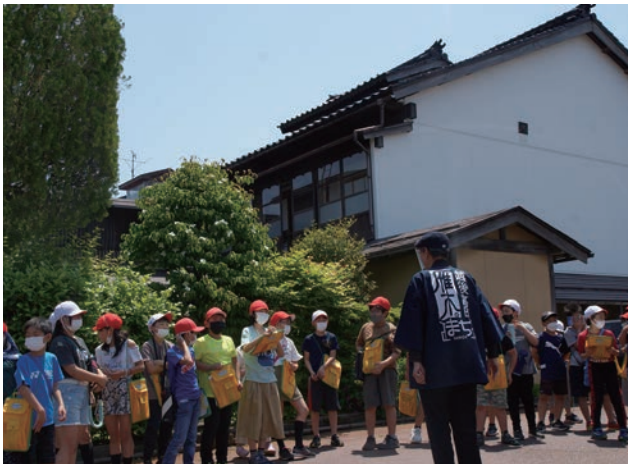
街歩きをしながら、高田の街の歴史や町家のつくりについて説明を受けている児童の様子。

10年前に受賞をした時の実績を基にしながらも、発展した教育実践が行われていることが評価され、優秀賞となった。(楚良)