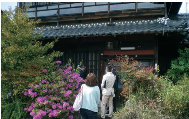
景観遺産審議会(現地審査)の様子。