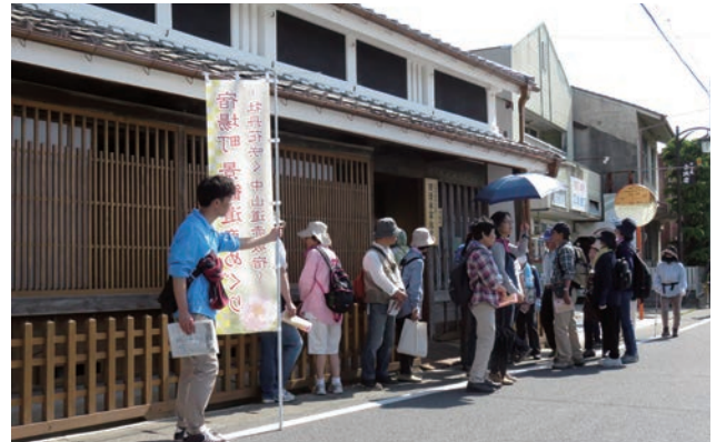
景観遺産めぐり(イベント)の様子。