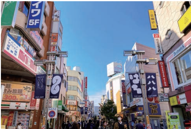
景観絵本をきっかけに良好な景観づくりを実践。「そめる」プロジェクトでは「はち」をモチーフにしたフラッグを掲出し、まちなかを彩る。