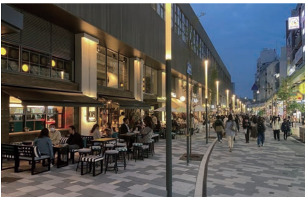
サンキタ通り(市道)は日中の荷捌き等貨物車両以外の通行をすべて排除。高架下店舗に設定したオープンテラスエリアにより街に賑わいが滲み出す。