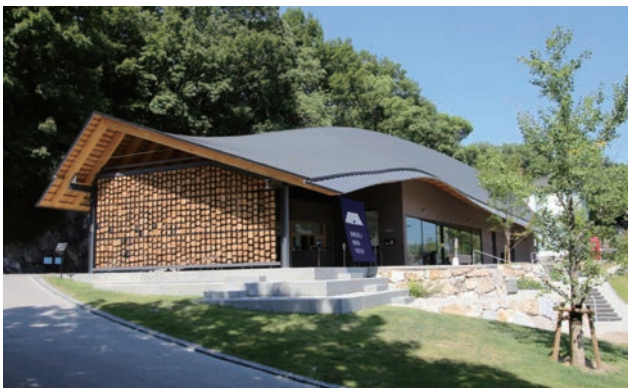
屋島正面の山麓に広がる、民間屋外博物館「四国村ミュージアム」は、「屋島スカイウェイ」との空間的な連続性を意識したリニューアルを行い、エントランス棟「おやねさん」が来訪者を迎え入れている。