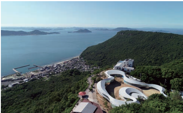
瀬戸内海国立公園内にある「屋島地区」は、「屋島スカイウェイ」で結ばれた山上区域（写真）と山麓区域から成り、眺望・景観に優れた自然環境と、長い歴史に彩られた人文景観が豊かな、高松市を代表する観光地である。

新たな魅力を発信している当地区には、コロナ禍前をも超える観光客が来訪しており、当地区は、本市の代表的な、また、中心的な、賑わいの拠点となっている。