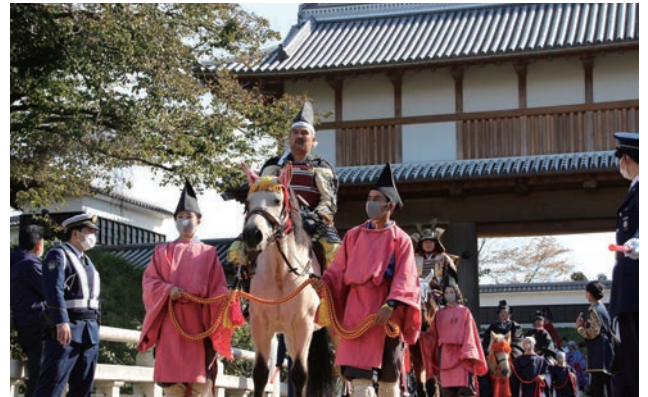
2020年2月に復元整備事業が完了した水戸城大手門。水戸東照宮の創建400年を記念した御祭禮行列が本地区内を練り歩いた。