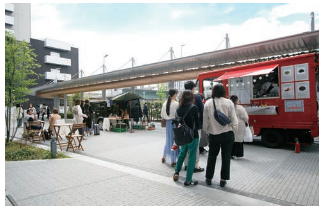
駅高架下商業施設側歩行空間で企画したキッチンカー。