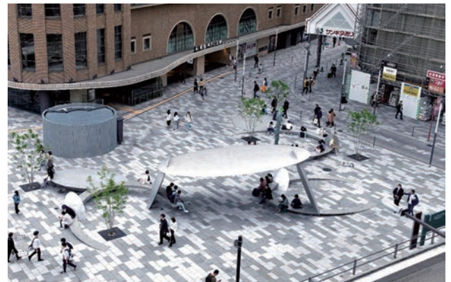
「えきまち空間」の象徴となるサンキタ広場。駅敷地、広場、街路は石畳舗装を段差なく連続させて一体的に整備。