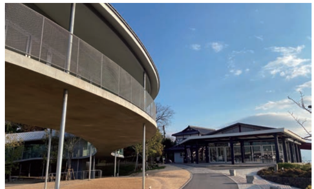
山上区域で、瀬戸内海を望む眺望点「獅子の霊巖」に隣接する「れいがん茶屋」（右）は、「やしまーる」（左）の整備に併せてリニューアルし、空間に一体感をもたらし、山上の賑わいとやすらぎを示す空間となっている。