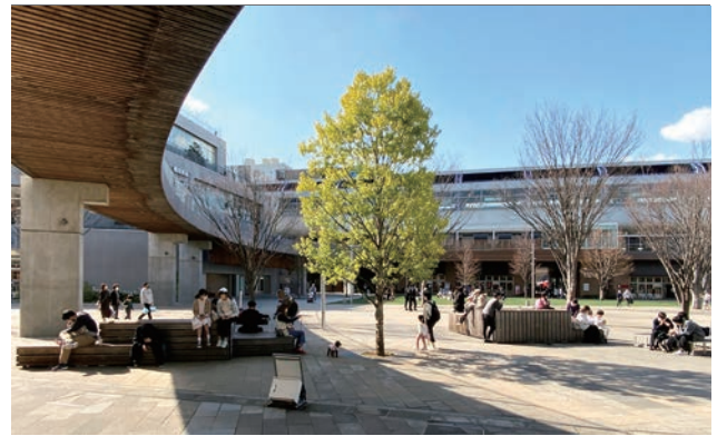
「谷」型の底となる「森のまち広場」をみる。ビッグファニチャーは様々な高さを用意することで、人それぞれに自発的な様々な使い方を促す。