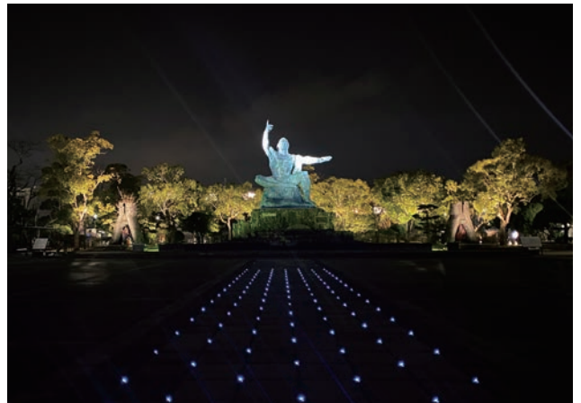
夜間景観整備によりライトアップをアップグレードした平和祈念像。右手(原爆)と左手(平和)を高機能スポットライトで照らしている。