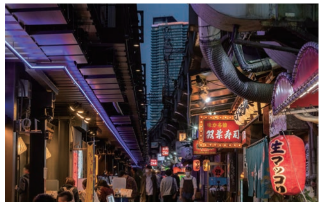
南側街路(駅敷地)(写真左側)は減築してオープンテラスエリアを確保。ネオン風LED照明により界隈性を活かした路地裏街路を演出。