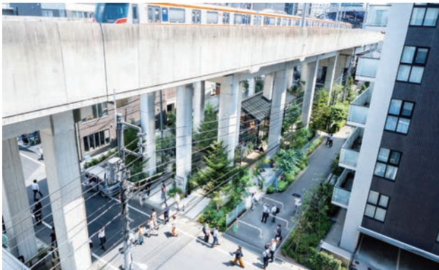
高架下の「GREEN PATH」を見下ろす。賑わいと緑が連続し、離散的な施設群をつなぐネットワークを形成している。