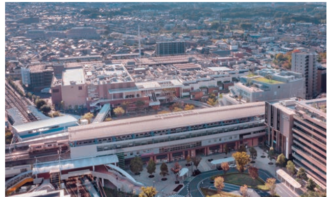
西側上空より地区全体をみる。それぞれの建物は“しりとり”のように関連し合い、回遊性の高い都市空間を形成している。