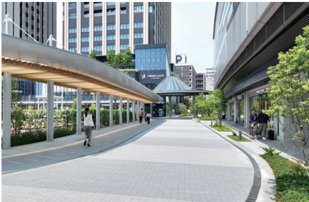
隣接施設と連携を図り一体の歩行者空間を創出し新たな都市景観を形成。

このように第3期整備では道路空間と沿道の建物空間の一体的な景観形成の魅力づくりに加えて、エリアマネジメントの仕組みも整備され、今後ますます金沢駅西広場での市民活用やイベントによる賑わい形成が期待される。以上のことから、優秀賞にふさわしいと評価する。（卯月）