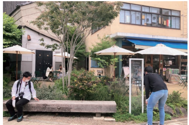
大学生と「まちの魅力再発見」をテーマにまち歩き。