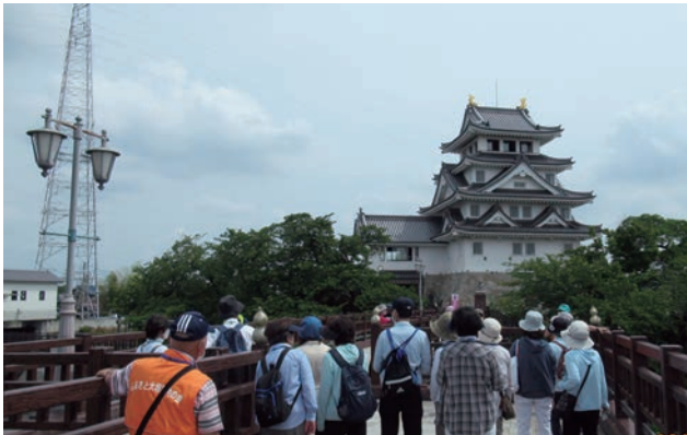
景観遺産指定番号第44号「一夜城址公園とその周辺」における景観遺産めぐり(イベント)の様子。

観光地や規模の大きな都市が注目されるなかで、歴史が多様に交差する大垣市では2008年から良好な景観形成に向けて景観計画を策定し、その3ヶ月後には景観条例を策定して「市民参加型景観まちづくり」を推進している。「子育て日本一」をめざす市の基本方針と市民の健康に配慮して街中にトリックアートを配置した仕掛けによるウォークアブルな都市をめざしていることは景観まちづくりに加えてウェルビーイングなまちづくりとして高く評価された。市民参加型の仕組みは、「市民からの自薦・他薦」によって景観遺産・景観自慢を募集し、それを市の景観審議会で遺産認定を行う。「意匠性・郷土性・表象性・規範性・親和性」という明快な基準を設置し、さらに現地視察を踏まえて登録されていくという市民への開かれた対応となっている。現在、約100件の「歴史文化遺産」「近代遺産」「現代遺産」「風景遺産」が登録されており、その遺産の銘板にはQRコードが2つ設置されていて、それらのコードは市のホームページとグーグルマップにリンクされ、このアプリは災害時にも活用できる。一方、学校教育で実施されている「ふるさと大垣科」、さらには景観市民団体の活動とともに、学校教育に導入されているタブレット活用と相まって未来を担う地域の児童・生徒への世代交代や次世代育成を視野に入れていることが高く評価され、優秀賞となった。(小澤)