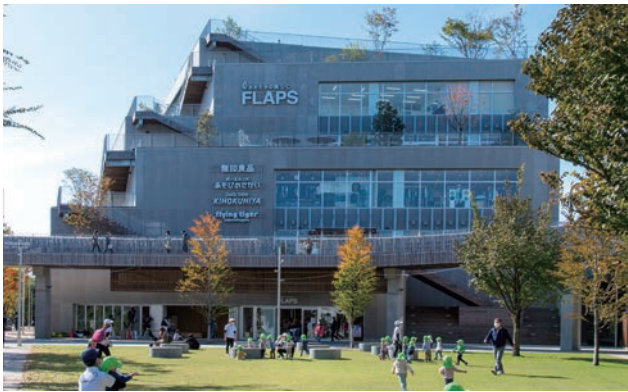
芝生広場から「FLAPS」をみる。北側の広場にも日差しを届けるセットバックした「山」型の建築形状により、明るいひだまりの広場が実現された。

「都心から一番近い森のまち」を掲げる流山市は、近年子育て世代の転入者の増加が著しい。都心まで30分足らずの利便性に加え、市の支援制度なども追い風になっているようだ。当地区は森の再生と緑のまちづくりを目指す行政と暮らしやすさと街の賑わいを標榜する民間が関係し、最初のショッピングセンターを誕生させ駅周辺整備の礎を築いた。それをきっかけに15年以上にわたり地道で丁寧な開発が継続されてきた。興味深い点はしりとりのように計画が関係し、点描画のように点が線となり面となって街並みが形成されてきたことである。駅舎内を貫通してできた南北自由通路、商業施設と駅舎をつなぐデッキは回遊性を向上させ、外装のデザインボキャブラリーの共通化、高架下のグリーンパスや、進行中の森のプロムナード計画は地域の一体感や関係を高めている。これは行政、事業者、地権者、設計者が共に手を携え、風通しの良い対話を続けてきたことの成果である。最後のピースと位置づけられた商業複合施設FLAPSと広場リノベーションの優れたデザイン性は駅前広場に山と谷の新たな都市地形を生み出し、駅前のアクティビティの向上に大きく貢献している。(富田)