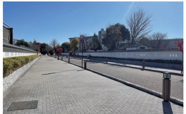
市立第二中学校前から杉山門方面に向かって見ます。学校施設の外構を白壁塀として整備を行った。