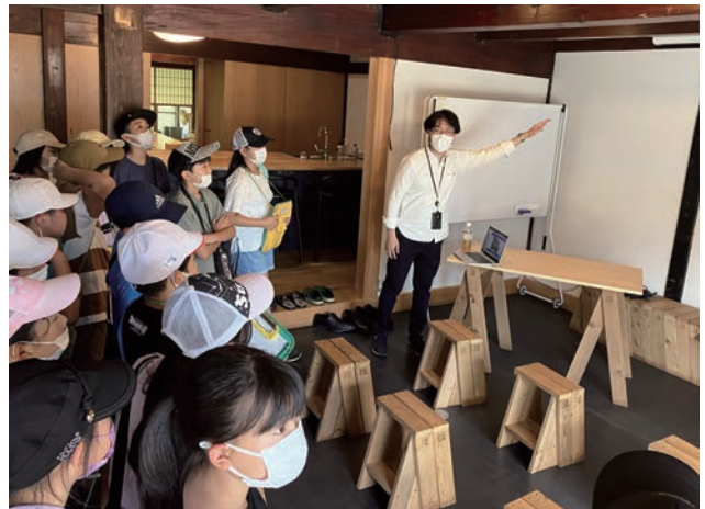
町家をオフィスとしているIT企業の社員の方から、町家がオフィスになったわけを聞く児童の様子。