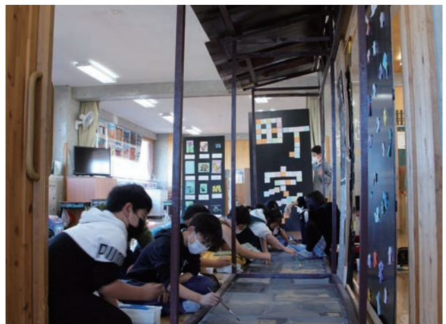
教室内に雁木を制作する児童の様子。家ごとに石畳の感じが異なることから、それをリアルに再現しようとしている。