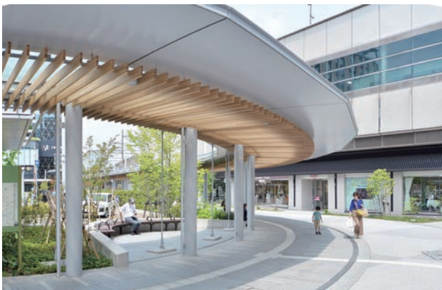
流線形の広場に呼応する歩行空間。駅高架下商業施設（右奥）は無窓壁面をガラス壁にし、金沢らしい意匠を凝らした庇に全面改装した。