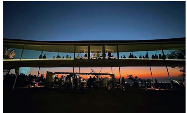
廃屋を撤去し整備した「屋島山上交流拠点施設」（愛称「やしまーる」）では、屋島から眺める美しい夕景・夜景の中でのイベントも開催され、屋島山上に多くの人が訪れ、周遊する、活気ある屋島の姿がよみがえった。

自然がつくりあげた場所の力を人が見出し、愛情を注いで造形し、さらにそこを数多の老若男女が愛で、記憶することで、名所は生まれる。屋島は瀬戸内の、高松の名所である。数百年に渡り多様な眼差しが注がれ続けた屋島は、平和な近代社会において観光地となり活況を呈し、そして衰退する。雄大な自然の魅力と楽しかった記憶を蘇生させるための取り組みが、立場を超えたデザインの力によって成し遂げられた。廃屋の撤去、国際レベルのデザインによる展望施設、呼応するリノベーション、快適なアプローチ、もてなしの企画と設え。これらが自発的、呼応的に展開したことで、屋島は新たな名所にふさわしい景観を造形し、瀬戸内の風景を愛でる人々の喝采を浴びる場所となった。文化財保護法、自然公園法、景観法といった制度による位置付けのもと、時間軸のなかで個々に開発されてきたドライブウェイ、園路、建築物などの一つ一つの要素を丁寧に、主体的に、真剣勝負で再生する取り組みを、名所屋島への敬意と愛情のもので連鎖させていく。本事例は、まさに持続性のある景観形成の先駆的モデルであり、多くの学びを得た。（佐々木）