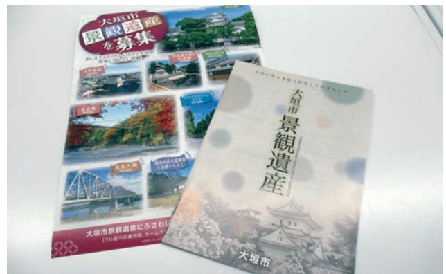
景観遺産募集チラシとパンフレット。