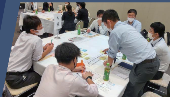
▲現地参加によるワークショップ (昨年度の様子)