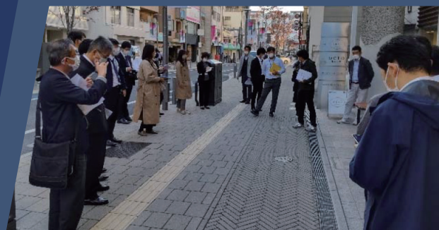
▲現地参加による現地まちあるき (昨年度の様子)