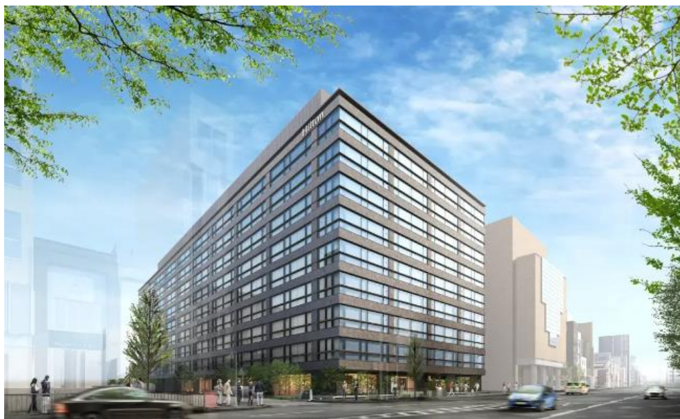
（仮称）京都三条河原町プロジェクト外観（イメージ）