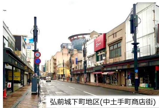
弘前城下町地区(中土手町商店街)