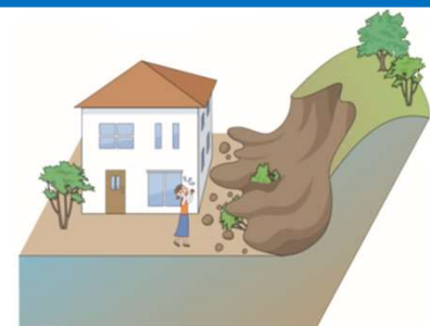
防災上の観点から適正な管理が求められる土地の例(イメージ)

◆「経済財政運営と改革の基本方針2019」(令和元年6月21日閣議決定)(抜粋) ・所有者不明土地等の解消や有効活用に向け、基本方針等に基づき、新しい法制度の円滑な施行を図るとともに、 土地の適切な利用・管理の確保や地籍調査を円滑かつ迅速に進めるための措置 、所有者不明土地の発生を予防するための仕組み、所有者不明土地を円滑かつ適正に利用するための仕組み等について 2020年までに必要な制度改正の実現を目指すなど、期限を区切って対策を推進する。