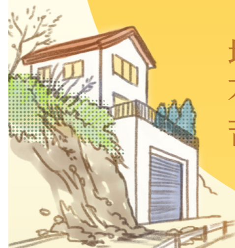
がけ崩れによる 道路の封鎖