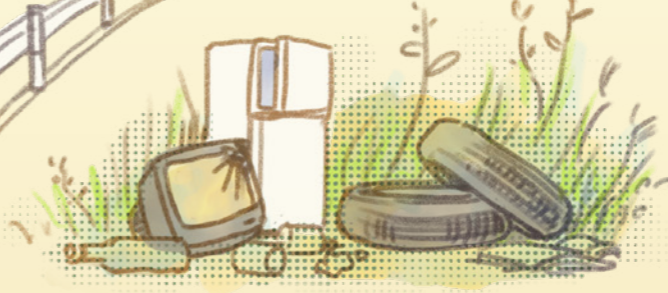
所有地へのゴミ投棄