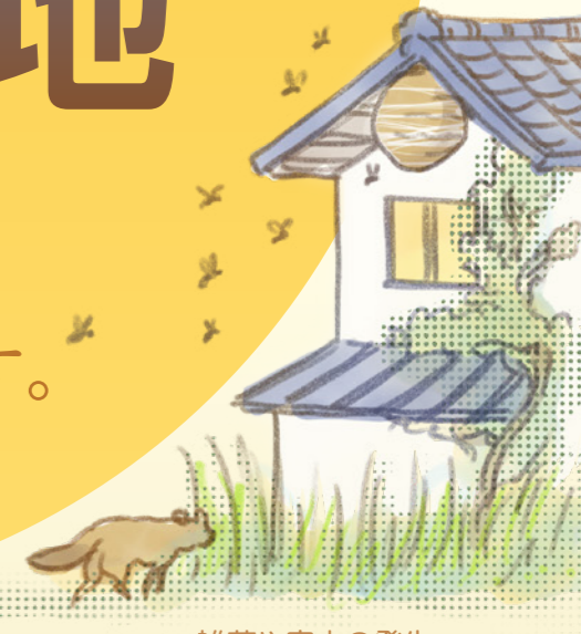
雑草や害虫の発生